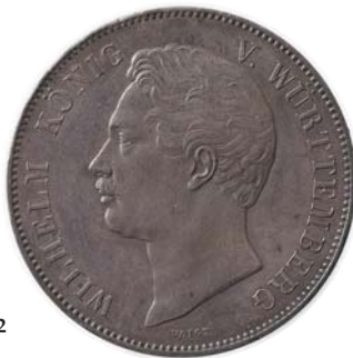
682 Germany - Württemberg: 2 Thaler 1846. MS 63