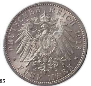
KM.618 Prooflike 4 500,- KM.281 0/01 1 700,-