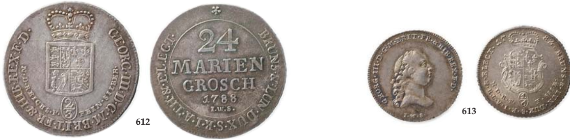
612 Germany - Brunswick-Lüneburg-Calenberg-Hannover: 24 Mariengroschen 1788 IWS. KM.341 0/01 750,- 613 Germany - Brunswick-Wolfenbottel: 1/6 Thaler 1782. KM.366 0/01 950,-