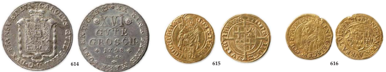
614 Germany - Brunswick-Wolfenbottel: 16 Gute Groschen 1798. KM.1020 0 850,- 615 Germany - Cologne: 1 Goldgulden 1480-1508. Herman IV of Hesse FR.802 01 3 400,- 616 Germany - Cologne: 1 Ducat 1575. Kanthakk/edgenick FR.813 1+/01 4 950,-