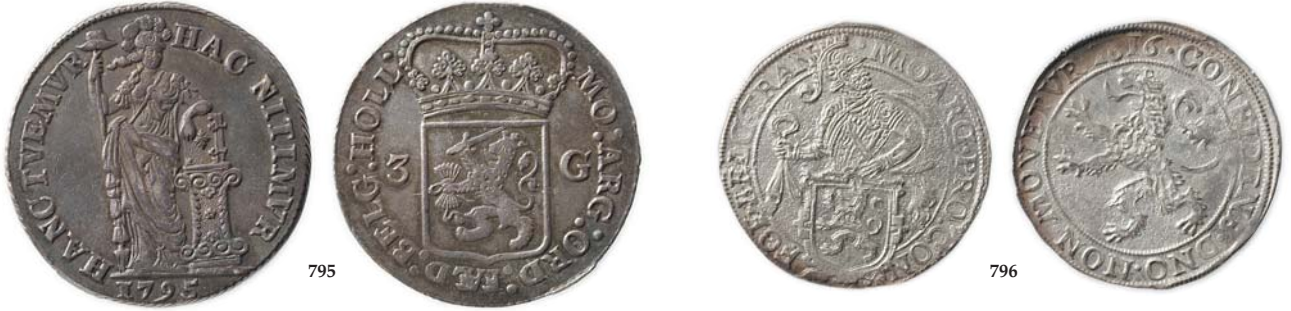
795 Netherlands: 3 Gulden 1795. West Freisland, Vakker patina KM.9.4 Dav 1853 01 1 200,- 796 Netherlands: 1/2 Lion Daalder 1616. Overysssel KM.11 01 800,-