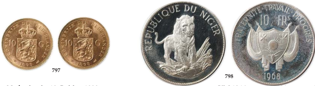
797 Netherlands: 10 Gulden 1898. 798 Niger: 10 Francs 1968. KM.1246 0/01 800,- KM.8.1 Proof 300,-