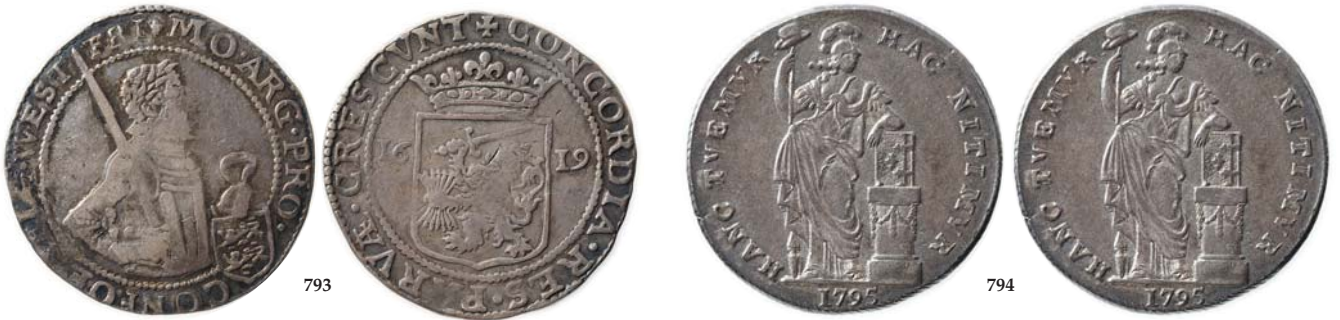
793 Netherlands: Rijksdaalder 1619. MMS West Friesland, Flott patina Dav 4842 1/1+ 400,- 794 Netherlands: 3 Gulden 1795. Vakker patina KM.9.2, Dav.1850 01 1 200,-