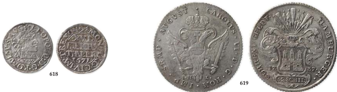
617 Germany - Corvey: 2 Mariengroschen 1655. Arnhold IV Waldois 1638-1661 KM.43 01 650,- 618 Germany - Dortmund: 1/15 thaler 1671 1671. Laureate bust of H.R.E. Leopold IKM.65 01 600,- 619 Germany - Hamburg: 32 Schilling 1737. KM.172 01 1 100,-