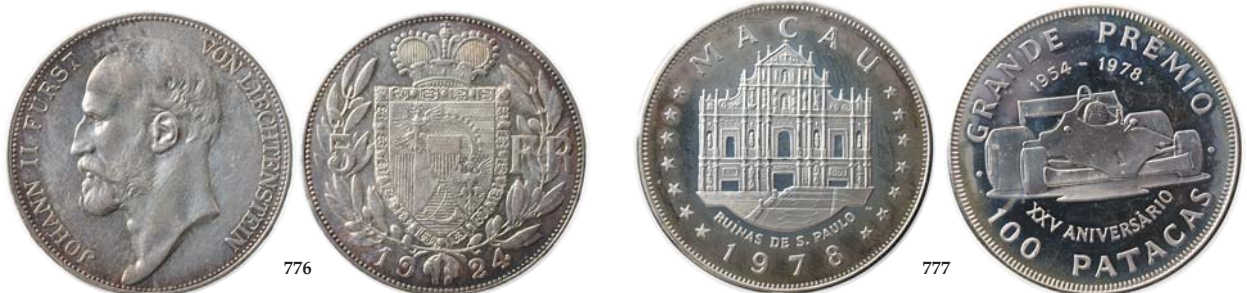
776 Liechtenstein: 5 Franken 1924. KM.10 0/01 2 500,- 777 Macau: 100 Patacas 1978. KM.10 Proof 750,-