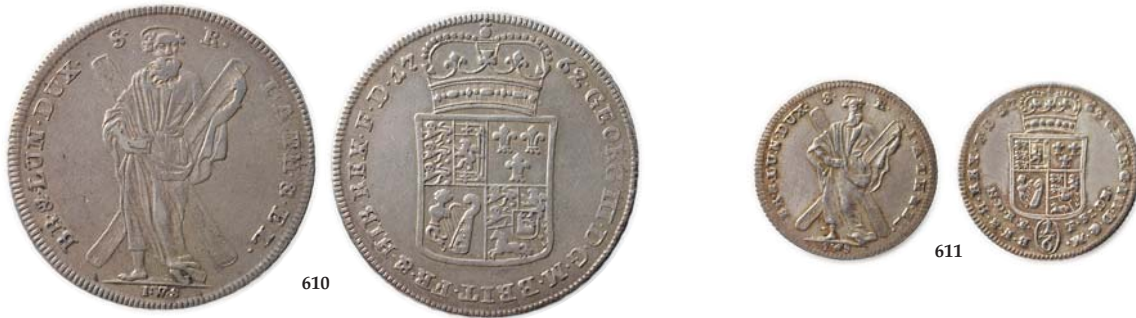
610 Germany - Brunswick-Lüneburg-Calenberg-Hannover: 1 Thaler 1762. KM.343 1+ 900,- 611 Germany - Brunswick-Lüneburg-Calenberg-Hannover: 1/6 Thaler 1762. KM.342 01 500,-