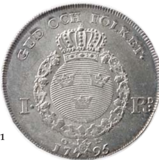
1002 Sweden: 1 Riksdaler 1795. Svakt preg