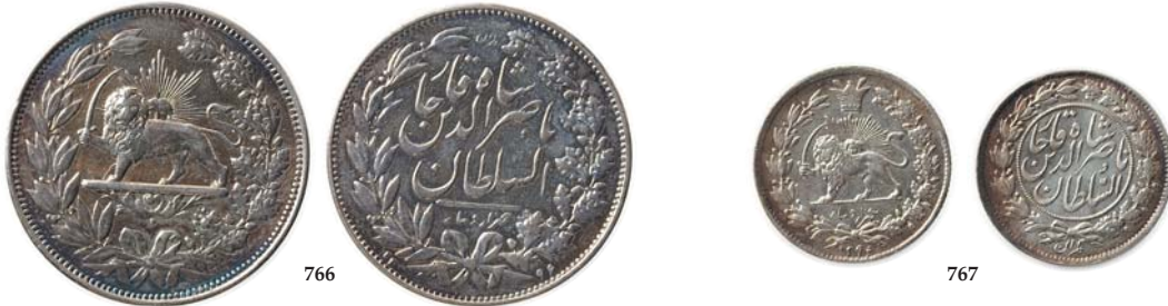
766 Iran: 1000 Dinars AH 1294. KM.899 01 1 400,- 767 Iran: 5000 Dinars AH 1296. KM.914 01 1 300,-