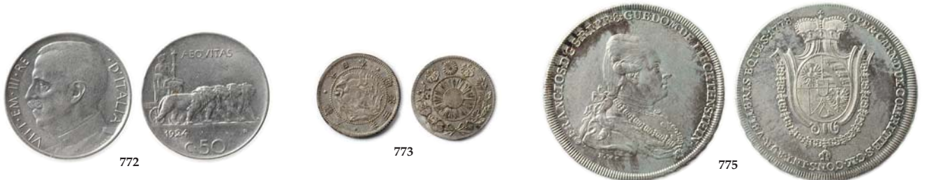
772 Italy: 50 Centesimi 1924. KM.61.1 01 1 000,- 773 Japan: 5 Sen 1870. KM.1 01 1 200,- 774 Japan: 5 Sen 1871. KM.6 01 600,- 775 Liechtenstein: 1/2 Thaler 1778. C.5 0/01 3 200,-