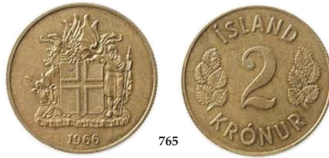
765 Iceland: 2 Kronur 1966. Tykkere metall, meget sjelden. Opplag 300 stk KM.13a.1 0/01 1 700,-