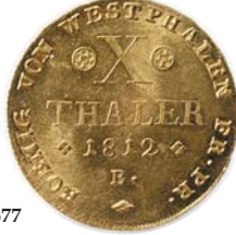
677 Germany - Westphalen: 10 Thaler 1812 B. MS 64