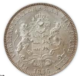
683 Germany - Württemberg: 1 Thaler 1866. MS 63 KM.596 0 3 000,- KM.615 0 1 800,-