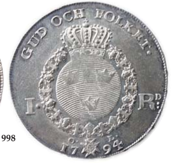
SM.24 0/01 2 500,-