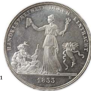
681 Germany - Württemberg: 1 Thaler 1833. MS 63 KM.pn3 01 2 000,- KM.570 0 2 000,-