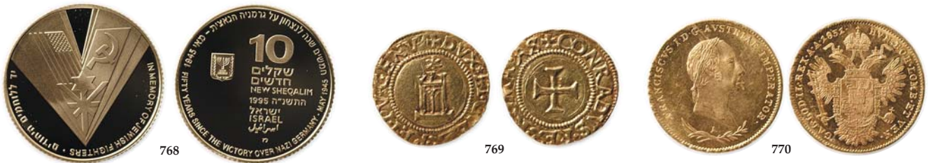
768 Israel: 10 New Sheqalim 1995. 50 Anniversary defeat of nazi Germany KM.269 Proof 1 700,- 769 Italy: 1 Scudo d'oro . Fr.399 01 3 200,- 770 Italy: Sovrano 1831. Lombardy-Venetia C.11.1 0/01 6 000,- 771 Italy: 1Billon Saldino 1880. Naples French Occupation. Louis XII 1501-1504. Paris mint Recreation of the historic ducatodoro in silver Crownet bust VG3962 0 1 200,-