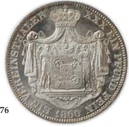
KM.48 Prooflike 2 800,- KM.48 0 2 500,-