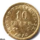
678 Germany - Westphalen: 10 Franken 1813 C. MS 62 Små kanthakk/Edgenicks C.32.1 0 5 000,-