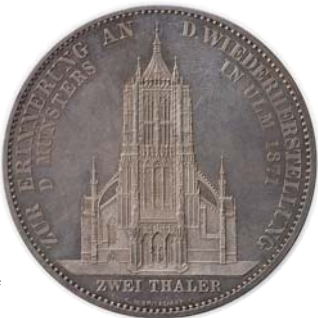
684 Germany - Württemberg: 2 Thaler 1871. 685 Germany - Baden: 5 Mark 1913.