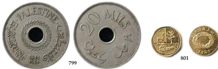
799 Palestine: 20 Mils 1941. KM.5 1+ 350,- 800 Palestine: 20 Mils 1944. KM.5a 1+ 250,- 801 Peru: 1/2 Escudos 1826 JM. MS 61 KM.146.1 0/01 1 100,-