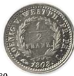
680 Germany - Westphalen: 1/2 Franc 1808c. Prøvemynt/pattern