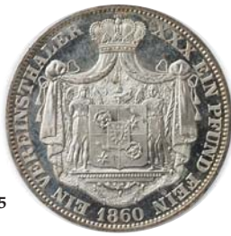
675 Germany - Schaumburg-Lippe: 1 Thaler 1860. 676 Germany - Schaumburg-Lippe: 1 Thaler 1860B.