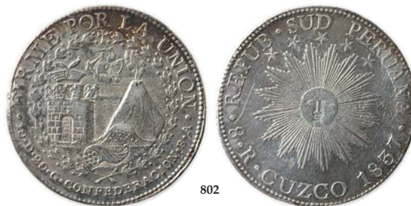
802 Peru: 8 Reales 1837. KM.170.2 1+/01 950,-